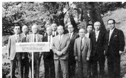
堀之内のツツジ植樹を記念して

もう一つ大事な植樹があります。クラブ創立40周年の記念事業として、松山城のお堀端にツツジを植えました、毎年初夏に見事に咲いています。あれは松山ロータリークラブの先輩がご自分達の手で植えたものです。